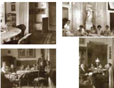
Dzielnia w Szkliszewie i jego malarzystywnie w latach 20 i 30. XX wieku