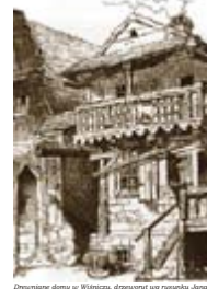
Drewniany dom w Wiśniczu, stworzony przy rybniku Janie Matejki