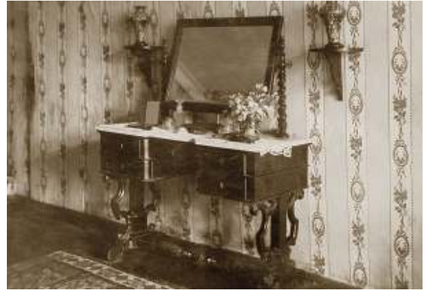
Wnętrza dworu w Jodłowniku, okres międzywojenny