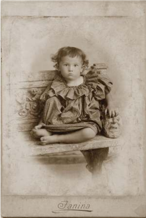
Aleksander Romer, 1897